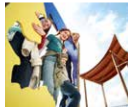
Kapelln: Der Mittelpunkt Niederösterreichs

Neben den großen Weinbaugemeinden bietet das Traisental noch ein paar Geheimtipps. So kann in Schweinern der keltische Baumkreis besucht werden. In Kapelln geht es zum Mittelpunkt Niederösterreichs, in Traismauer zu den geschichtsträchtigen Stätten der Weinkultur. Hohlwege in Wagram, die Pflanzen- und Kräuterwelt um Sankt Andrä, sogar der Jakobsweg werden in Kuffern bewandert, die Trasdorfer „Hiata-Hitt'n“ steht genau so am Programm wie Architektur und Wein in Wagram oder Reichersdorf. Nähere Informationen ab Seite 10