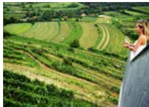
Am Aussichtsturm „Korkenzieher“