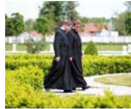
Die Mönche im barocken Stiftsgarten Herzogenburg

Bei Touren rund um Herzogenburg sind das traditionsreiche Augustiner Chorherrenstift Herzogenburg samt Stiftsweingut wie auch das Reitherhaus mit angeschlossener Vinothek gern besuchte Ziele. Vieles über alte Werkzeuge, Kunst und Wein, aber auch Geschichte von Wein- und Obstbau erfahren die Gäste der Herzogenburger Weinbegleiterinnen und Weinbegleiter. Die Verkostungen finden im eigenen Keller oder im eigenen Heurigenlokal statt. Nähere Informationen ab Seite 8